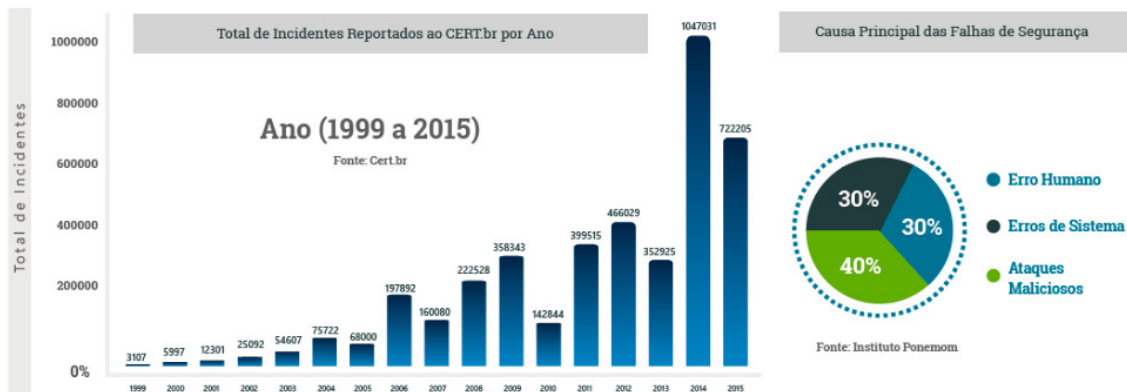
Figura 2: Principais falhas de segurança e seus incidentes

maliciosas seja no computador, ou sistema de informação.